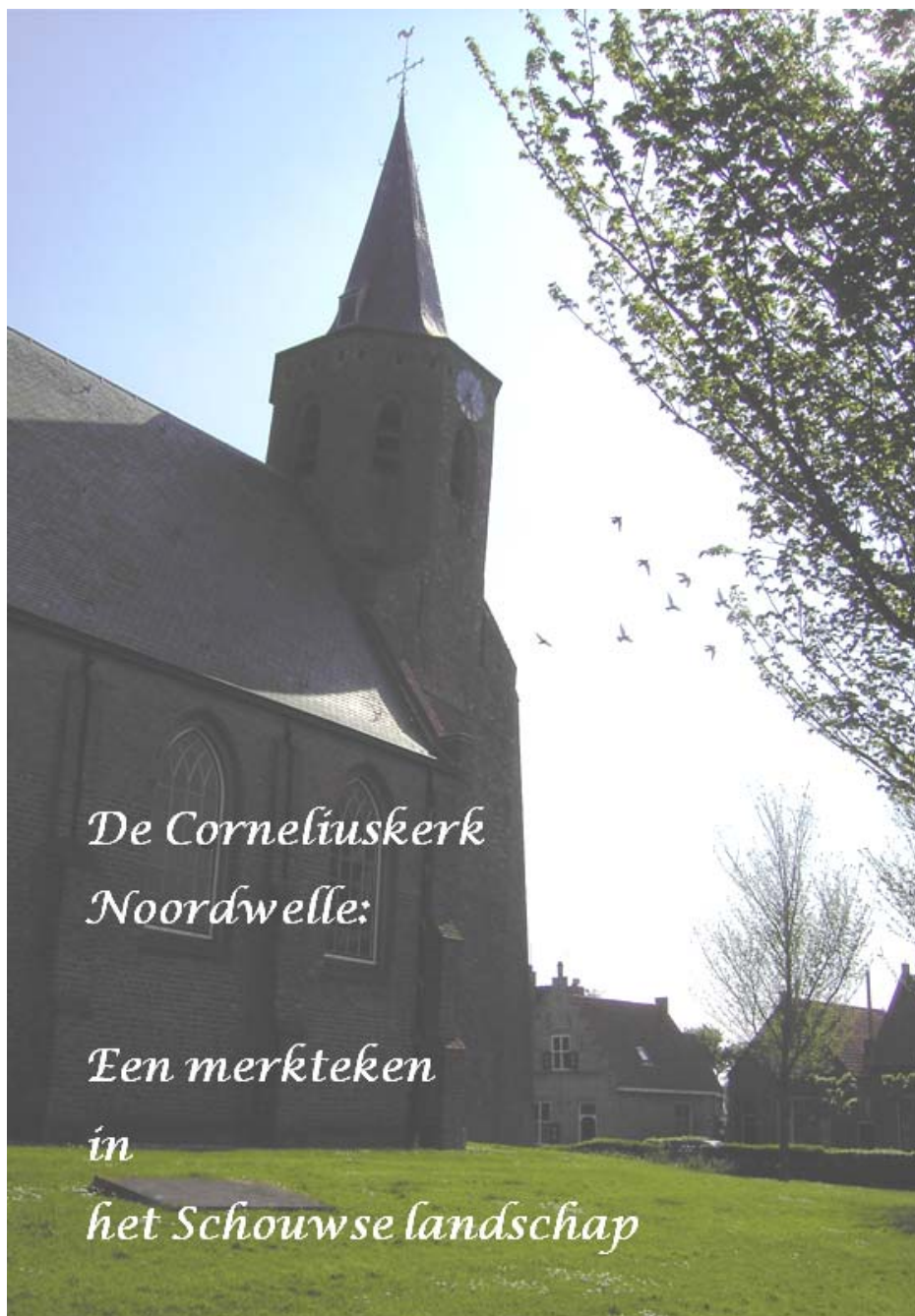
Uitgave van de Vrienden van de Dorpskerk Noordwelle